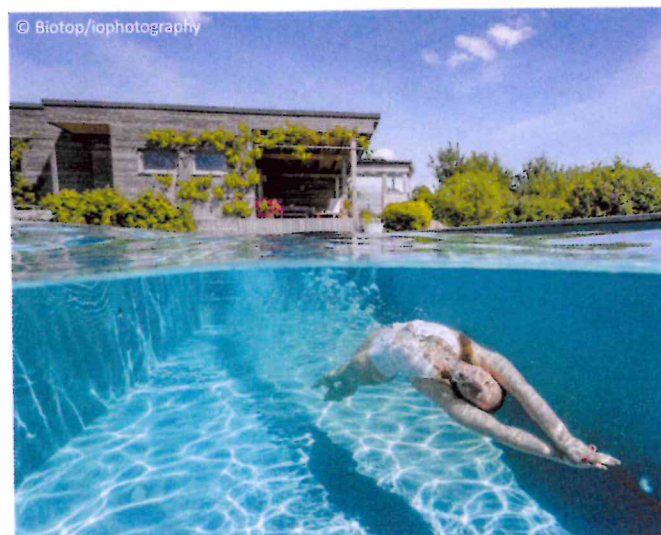
Pures Schwimmvergnügen in natürlichem Wasser lässt einen den Alltagsstress vergessen.

Biotop Naturpools schaffen mit ihrem klaren, glitzernden Wasser und blühenden Wasserpflanzen eine wahre Wellness-Oase – ideal, um Stress abzubauen und den hektischen Alltag hinter sich zu lassen. Außerdem stehen sie für nachhaltigen Badespaß, denn sie gehen sorgsam mit wertvollen Ressourcen um. Das Wasser kommt ohne jegliche Chemikalien aus und kann jahrelang im Becken verbleiben. Ebenso entfällt das Entleeren vor dem Winter. In Zeiten immer heißerer und trockenerer Sommer ist Wasser wertvoller denn je. Mit einer Photovoltaikanlage ist sogar ein „Null-Energie-Naturpool“ möglich. Das hilft nicht nur der Umwelt, sondern auch Geld und Ressourcen einzusparen. Wer sich für einen Naturpool entscheidet, setzt auf ein nachhaltiges, gesundes Schwimmvergnügen und bewusstes Leben.