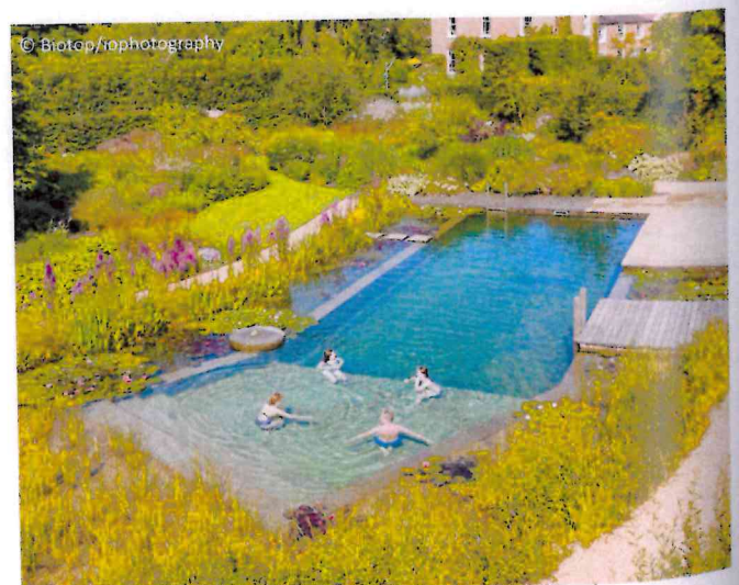
Ein Paradies für die ganze Familie

Ob man sich für einen Biotop Living Pool oder Swimming Pond entscheidet, ist den individuellen Vorlieben überlassen. Beide Varianten